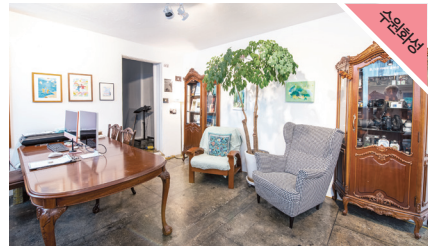
사진 서점 겸 스튜디오입니다. 사진이 너무 좋아 열게 된 '곤, 그곳'은 이름 자체도 공간의 의미를 담고 있습니다. '곤'은 시간을 의미하며 '곳'은 공간을 의미하는데 이는 사진에 필요한 요소를 뜻합니다. 곤, 그곳은 차별 없이 누구나 자유롭게 머물 수 있는 공간을 지향합니다. 영리 목적을 위한 스튜디오이지만, 이곳에서 이루어지는 모든 과정이 치유이길 바라며 작업합니다.