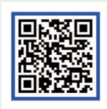
「2023 문화1호선 기록영상 URL」

2023년 운행을 마무리하는 결과공유회가 12월 1일 수원메ッセ에서 진행되었다. 결과공유회의 부제는 <좋은 일을 만들었나요?> 이다.